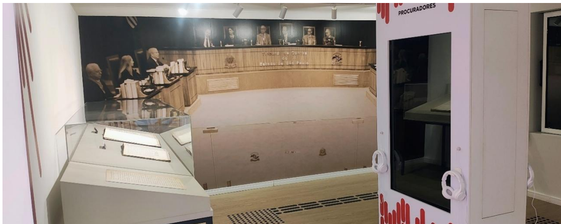
Como estava organizada a 1ª sala de exposições antes do lançamento da mostra temporária “O Paulista de Macaé: Washington Luis e os 100 anos do TCESP”.