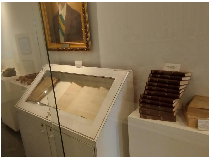
Parte da Exposição no antigo Espaço Histórico que estava localizado ao lado do Auditório Nobre – armário contendo o “processo nº 1” de 1947 e números encadernados da revista “Jurisprudência e Instruções”.

Todos os objetos, documentos e mobiliários anteriormente expostos no antigo Espaço Histórico — inaugurado em 2007 e desativado em 2024 — foram catalogados e integralmente preservados. Parte desse material integra as exposições atualmente em exibição, enquanto outra parte encontra-se acondicionada na reserva técnica.