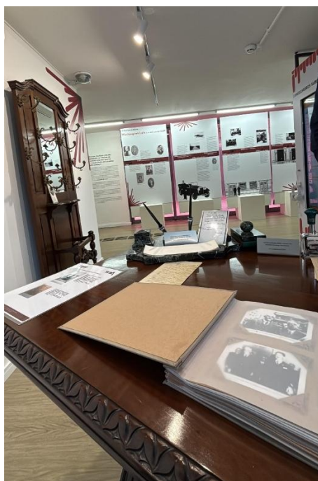
Nova Exposição do Memorial do TCESP - mesa com objetos e fac-símiles, e linha do tempo ao fundo sobre a trajetória política de Washington Luis