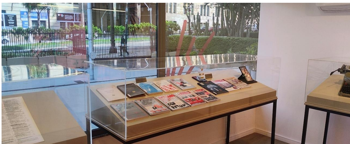
Vitrine que estava posicionada na 2ª sala de exposições contendo os exemplares da Revista TCESP antes do lançamento da mostra temporária “O Paulista de Macaé: Washington Luís e os 100 anos do TCESP”.