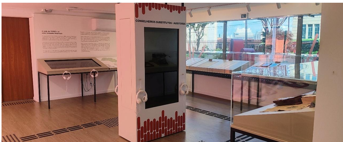
Como estava organizada a 2ª sala de exposições antes do lançamento da mostra temporária “O Paulista de Macaé: Washington Luís e os 100 anos do TCESP”.