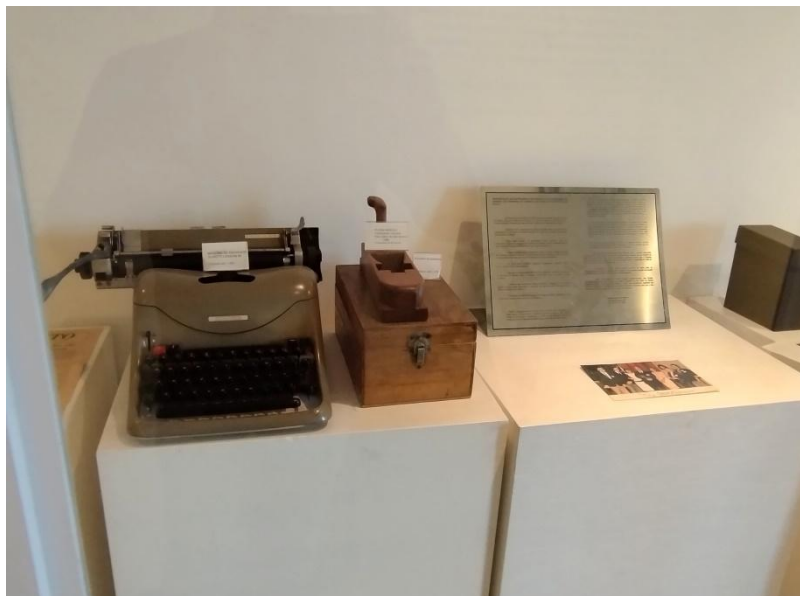
Parte da Exposição no antigo Espaço Histórico que estava localizado ao lado do Auditório Nobre – materiais de escritório, placa comemorativa e fotografia de evento de confraternização.

Entre os itens preservados e atualmente incorporados ao acervo, destacam-se: